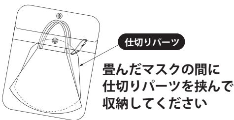
＜立体マスク収納イメージ＞